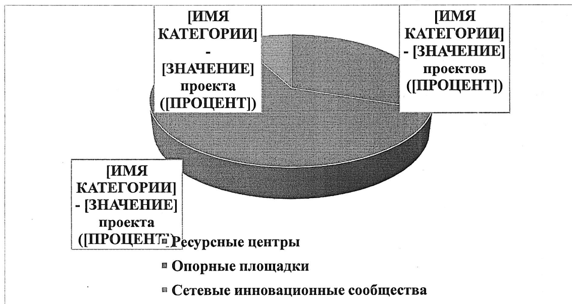
Рис. 2. Форматы реализации муниципальных инновационных проектов

Наиболее распространенный формат реализации муниципальных инновационных проектов – опорная площадка и ресурсный центр. Количество проектов, реализуемых сетевыми инновационными сообществами, ограничено по тематике, но обеспечивает вовлечение в процесс большое количество образовательных организаций, так в 4-х проектах участвуют 27 образовательных организаций. Ресурсные центры также обеспечивают широкое вовлечение в инновационную деятельность образовательных организаций муниципальной образовательной системы через организацию сетевого взаимодействия с базовыми площадками или соисполнителями проекта. Форматы реализации муниципальных инновационных проектов представлены на рисунке 2.