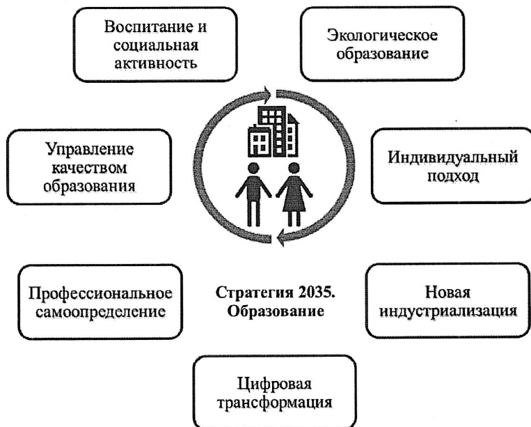
Рис. 3. Основные направления деятельности муниципальных инновационных площадок

Основные направления деятельности муниципальных инновационных площадок в 2022 году представлены на рисунке 3.